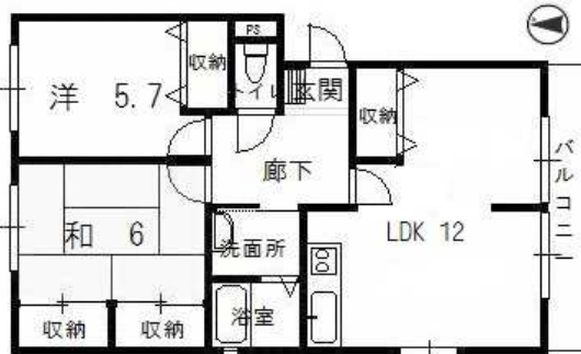
102間取 (101は上下反転になります)