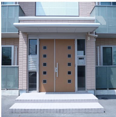
オートロック付き