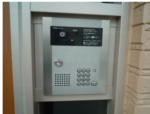
オートロック付き