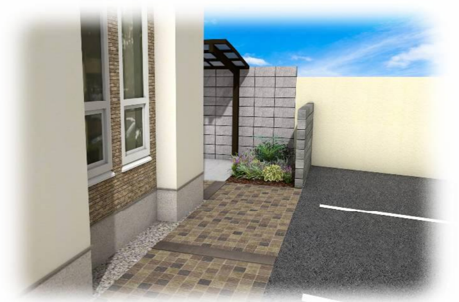
外構工事完成予想図