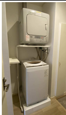
衣類乾燥機（ガス式）+洗濯機付