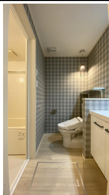
脱衣場とトイレが一体型になっています