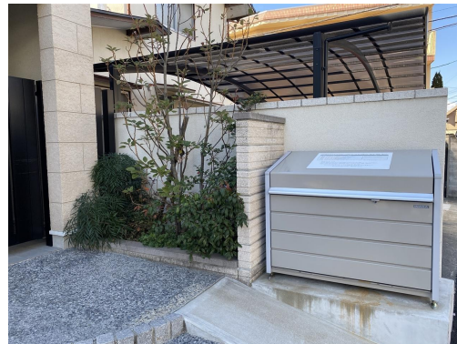
専用ゴミストッカー