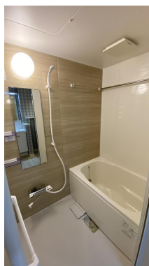
追焚機能付きオートバス