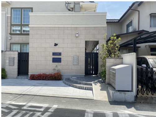
1階専用のオートロックゲート