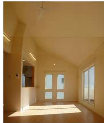
※実際のお部屋の写真です (午前11時頃)